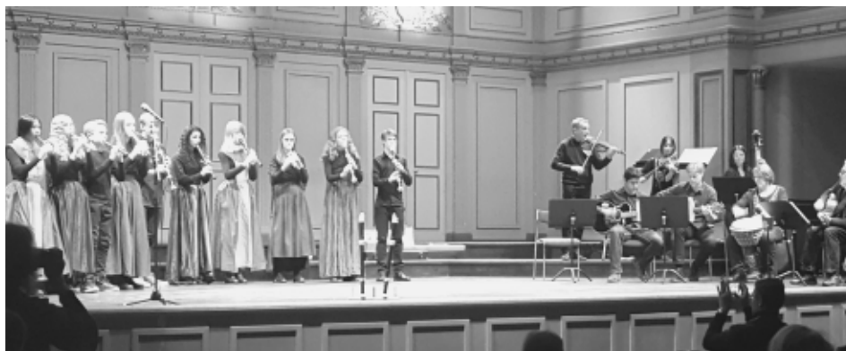
Solnan musiikkikoulun oppilaat esiintyvät